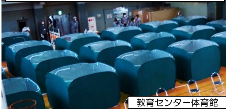
教育センター体育館

新型コロナウイルス感染症への対応マニュアルに基づいた避難所開設・運営訓練が実施されました。